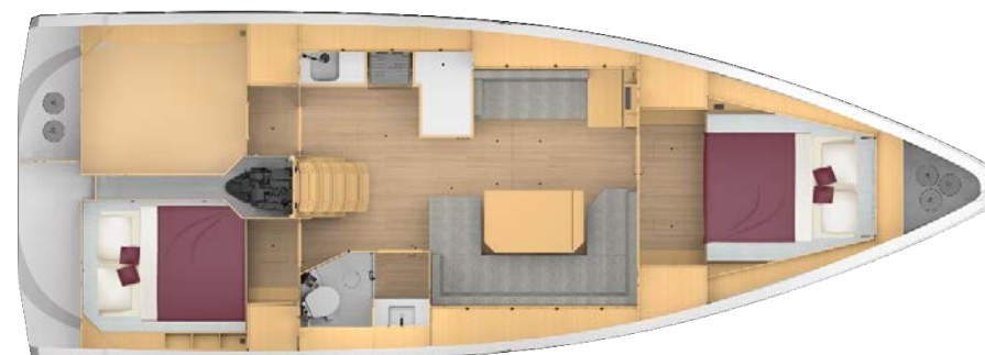
Cabin layout 2 - 1