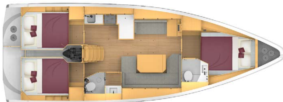
Cabin layout 3 - 2