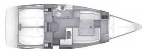
Version B 1 cabina a prua, 2 cabine a poppa, 1 bagno