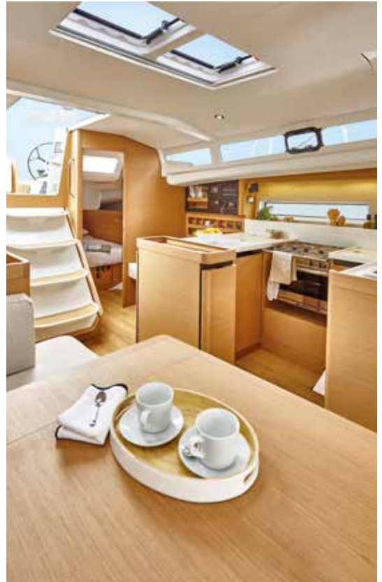
► A bright saloon Un carré lumineux Ein helles Salon Un salón brillante Un salone luminoso