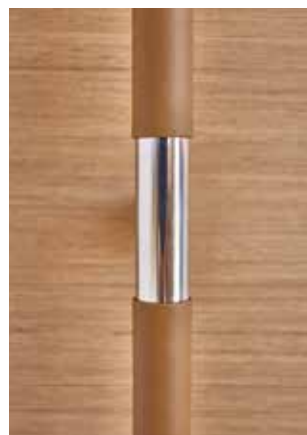
◀ Elegant touch Finition élégante Elegantes Finish Elegante acabado Finale elegante